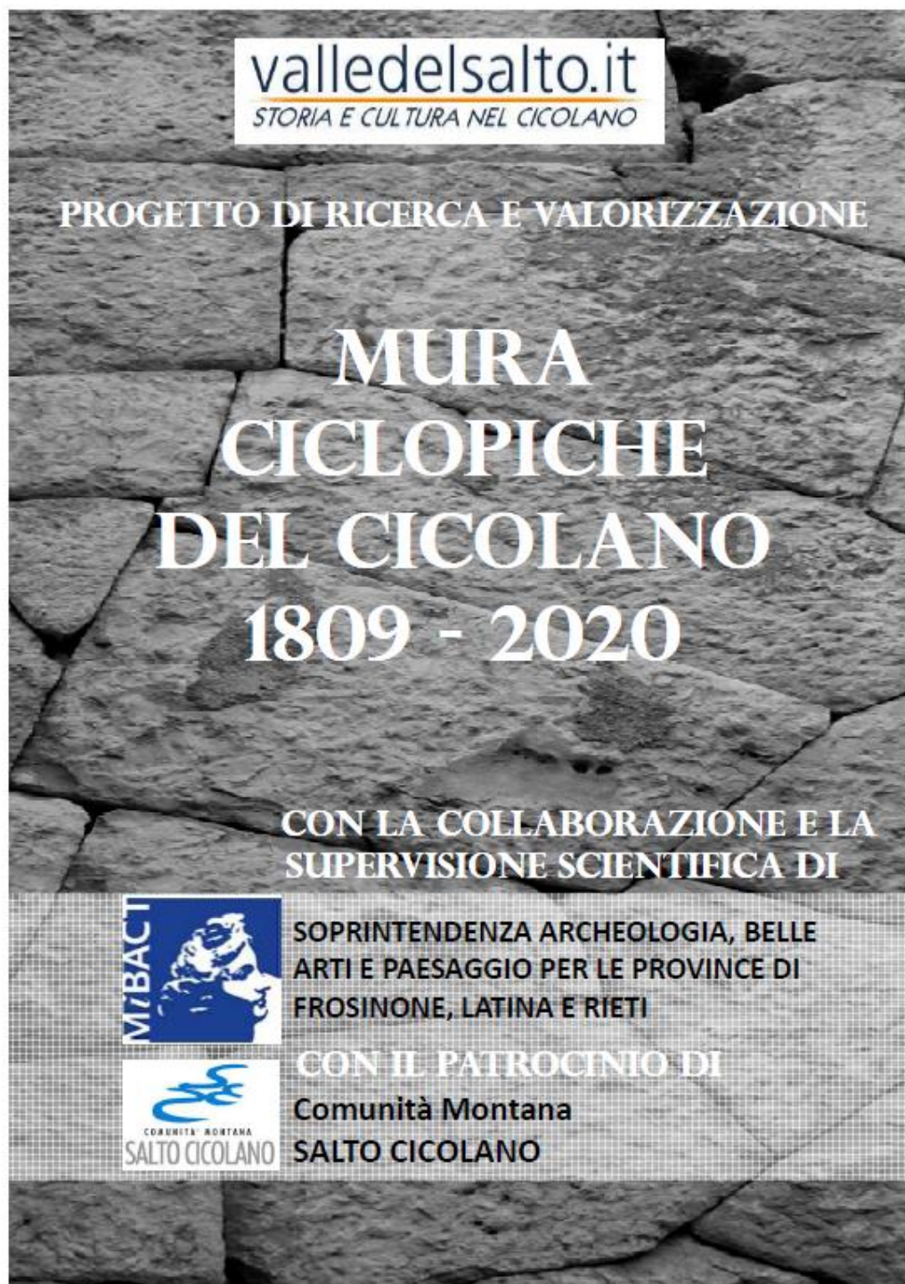
Copertina del progetto di ricerca e valorizzazione dei siti con resti di mura in opera poligonale della Valle del Salto.