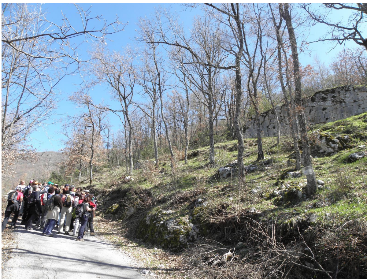
Escursionisti osservano il muro in opera poligonale del complesso archeologico della Grotta del Cavaliere.