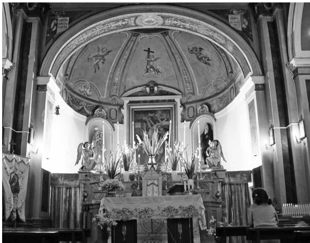
Altare centrale della Chiesa di S. Croce di Villerose

Il testo che viene presentato è la trascrizione del registro delle “cresime” ( Liber confirmationis ), nel quale sono riportati i nomi dei “pueri” e delle “puellae” che hanno ricevuto il sacramento della cresima ( Sacramentum confirmationis ) nella chiesa di S. Croce di Villecollevegato ( In Ecclesia S. Crucis Villarum Collisvegati ) 1 nell’arco temporale dal 1828 al 1917 2 .