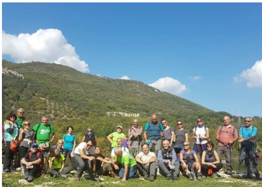
In lontananza, gli spettacolari resti delle Terme di Tito