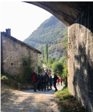
Sotto il ponte della nuova Salaria

La camminata è stata ricca di argomenti culturali e storici iniziando dal primo tratto, quindi dall'antica abbazia, incrociando "La via del Marrone" tra Antrodoco e Borgovelino, le terme di Tito a Castel Sant'Angelo, fino alle sorgenti del Peschiera e l'antica mola Scorretti.