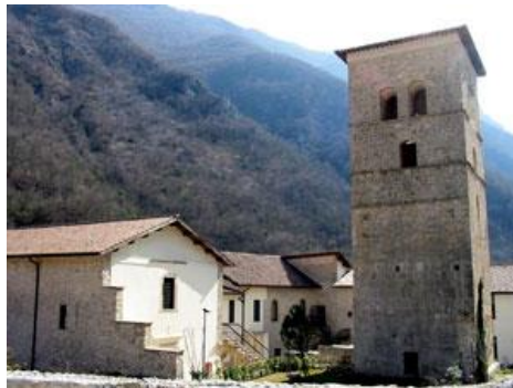
Abbazia dei SS. Quirico e Giuditta (Micigliano, RI)