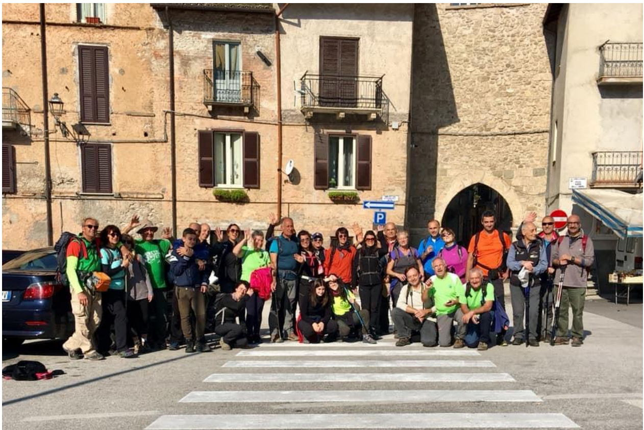
Gli escursionisti sulla piazza di Antrodoco