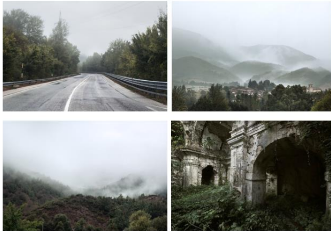
Italia, E1, Fotografo: Fabrizio Cerroni, Roma, Italia

Nella foto che segue, in primo piano i tre vincitori italiani, da destra: Danilo Marabini, Fabrizio Cerroni, Luca Eleuteri