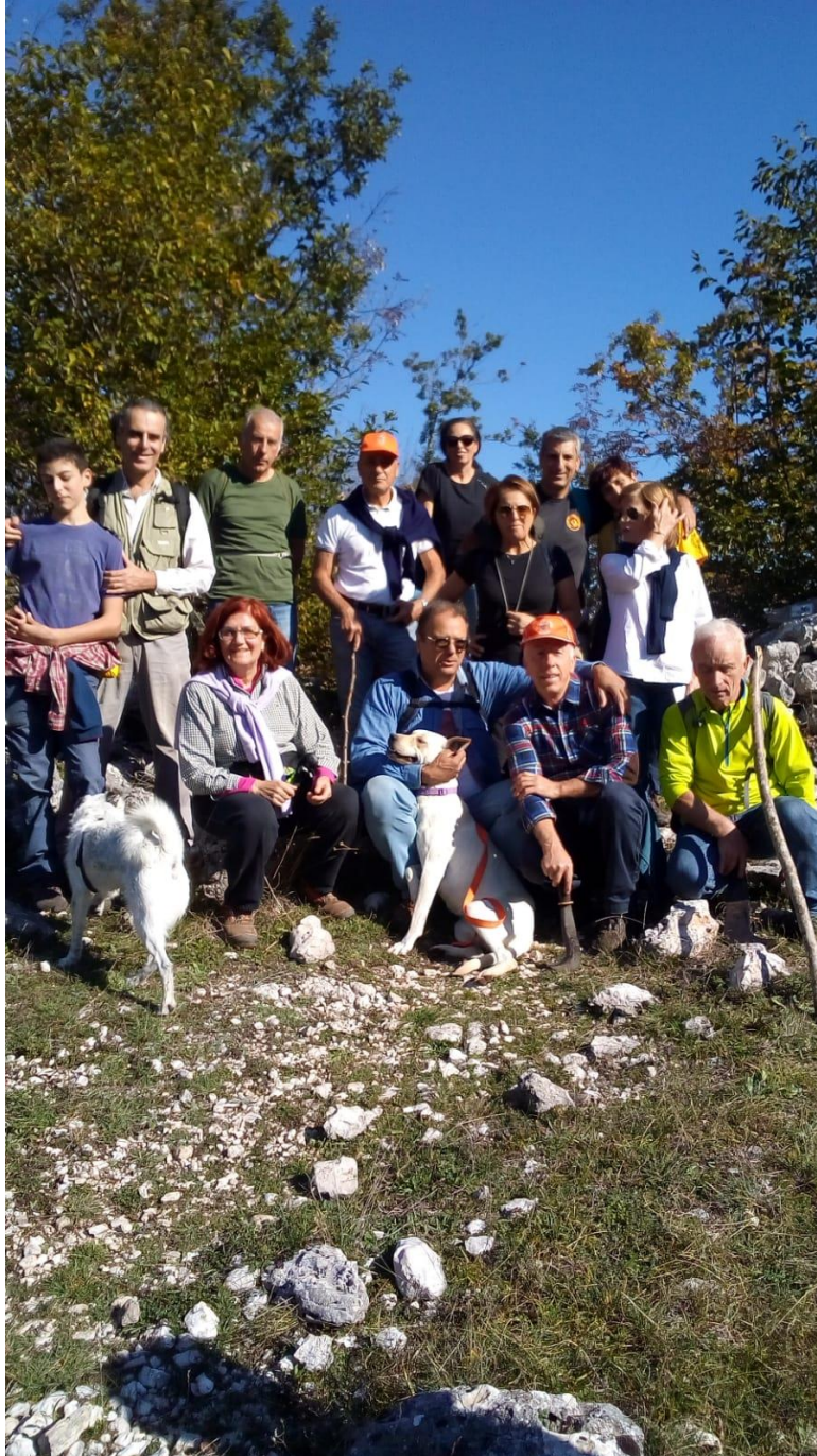
Valico di Val de' Varri

Serviva a raggiungere i pascoli in quota, e la notte di Natale era affrontato dai fedeli dell'Acquaviva che andavano ad ascoltare la messa di mezzanotte a Poggiovalle. Più di due ore di salita e discesa tra andata e ritorno, qualche torcia e un'allegria esagerata, ostentata a gran voce per esorcizzare il buio e la paura.