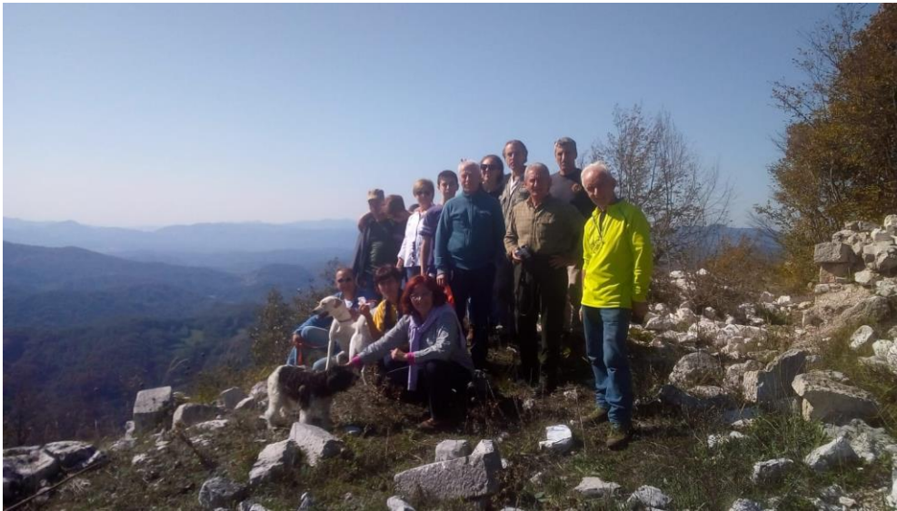
Sulla cima del monte Sant'Angelo

Qui, lasciamo il Cammino dei Briganti ed iniziamo la salita verso la vetta del Monte Sant'Angelo.