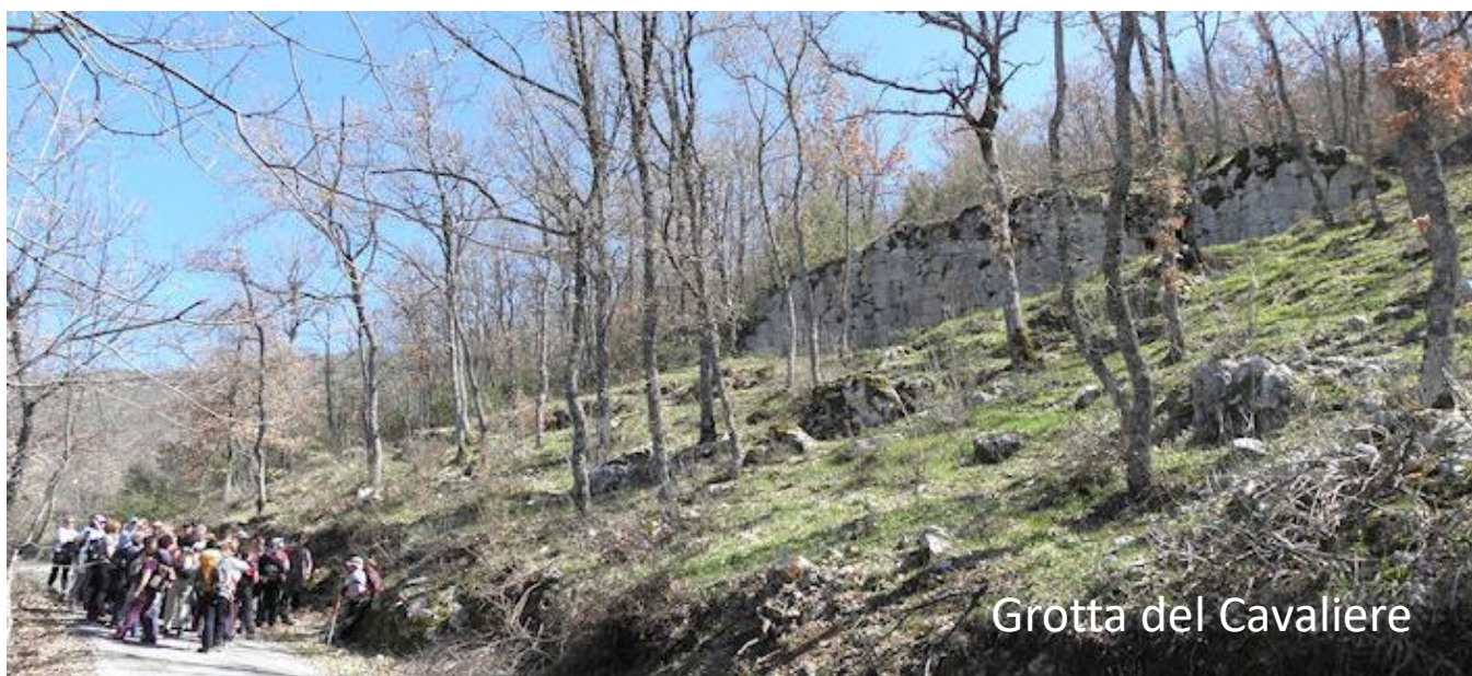
Grotta del Cavaliere

L'anello escursionistico da S. Elpidio a S. Elpidio comprende la visita di siti con resti di mura poligonali (ciclopiche o pelasgiche), conosciute con i nomi di Grotta del Cavaliere, S. Lucia vicino a Collemaggiore e Colle Vetere. Accompagnerà i partecipanti l'archeologo Paolo Camerieri. Prima della partenza (ore 9.00) e dopo l'arrivo (ore 16.00) i partecipanti potranno visitare un estratto della mostra "Una nuova stagione per l'Appennino centrale", un territorio tra memoria e futuro , allestita all'interno della palestra dell'Edificio scolastico di S. Elpidio, cortesemente concessa dall'Istituto Comprensivo Statale "Giovanni XXIII" di Petrella Salto.