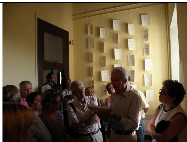
LIBRI DI GOOGLE