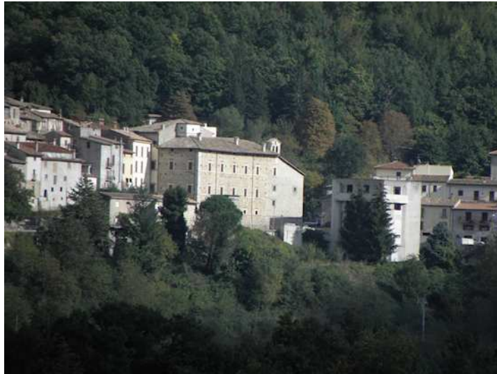
IN PRIMO PIANO PALAZZO MAOLI VISTA LATO OVEST

Il catalogo documenta la mostra “Alla riscoperta dei monumenti della Valle del Salto da disegni e racconti dei viaggiatori europei dell’Ottocento” , tenuta dal 10 al 22 agosto 2010 a Petrella Salto (Rieti), presso Palazzo Maoli, cortesemente concesso dalla Comunità Montana Salto-Cicolano e dal Comune di Petrella Salto.