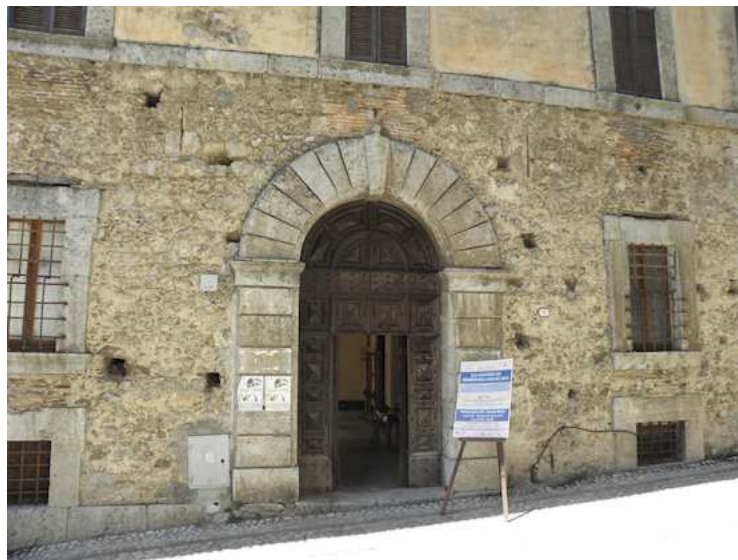
INGRESSO ALLA MOSTRA LATO EST PALAZZO MAOLI