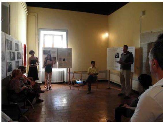
UN MOMENTO DELLA LETTURA