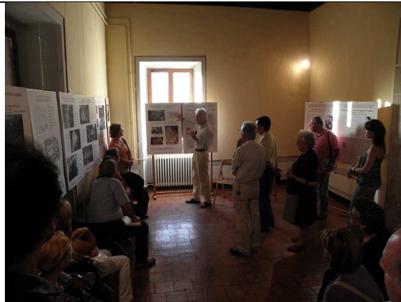
LA GROTTA DEL CAVALIERE AD ALZANO