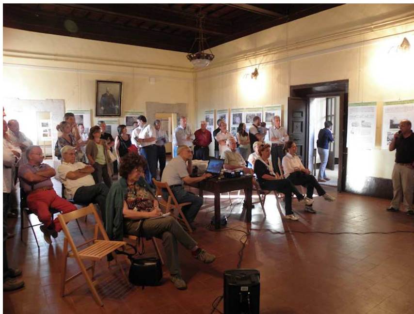
PRESENTAZIONE DI PIETRO PIERALICE DEL SENTIERO EUROPEO E1

Altro evento, tenuto in parallelo alla mostra, la presentazione dello stato di avanzamento del progetto del Sentiero Europeo E1 nel Cicolano con la partecipazione di Pietro Peralice presidente della Federazione Italiana Escursionismo Comitato Lazio.