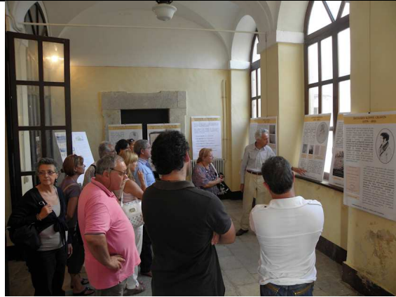
STUDIOSI E VIAGGIATORI