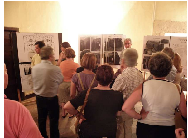
LA CRIPTA DI S.GIOVANNI IN LEOPARDO