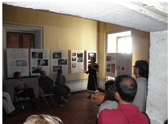
UN MOMENTO DELLA LETTURA