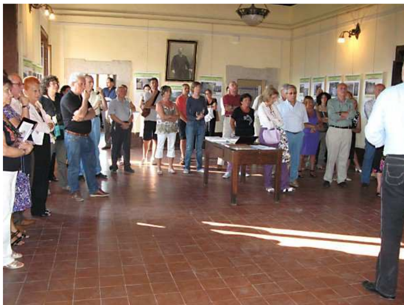
INAUGURAZIONE E APERTURA DELLA MOSTRA 10.08.2010, ORE 17.00