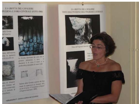
UN MOMENTO DELLA LETTURA