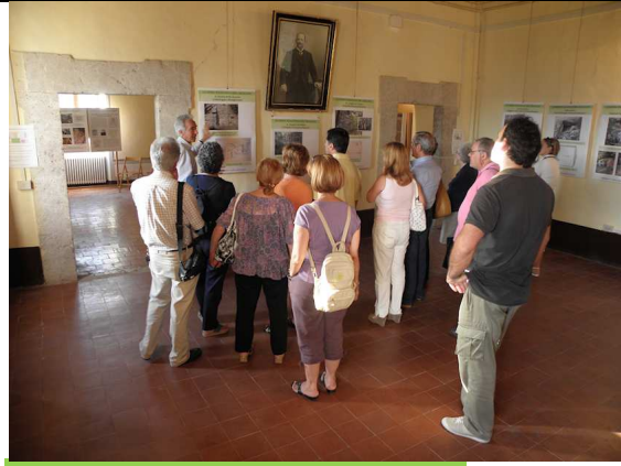
COSTRUZIONI IN OPERA POLIGONALE